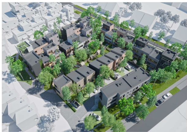
oprac. Pracownia INSOMIA

Spotkanie przybliżyło nam niezwykle ciekawy projekt urbanistyczny realizowany na poznańskim Strzeszynie. Na powierzchni ok. 16000 m 2 , powstaje niezależny układ urbanistyczny dla całego kwartału w tej części miasta.